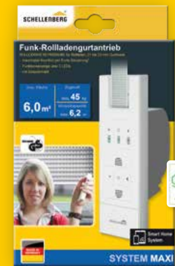
Funk-Rollladengurtantrieb, Art.-Nr. 22767

Rollladensystem MAXI (Blau) - für große Rollladenflächen - Rollladengurtbreite 18-23 mm Rollladensystem MINI (Grün) - für enge Platzverhältnisse - Rollladengurtbreite 14 mm