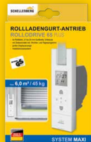
Rollladengurtantrieb, Art.-Nr. 22766