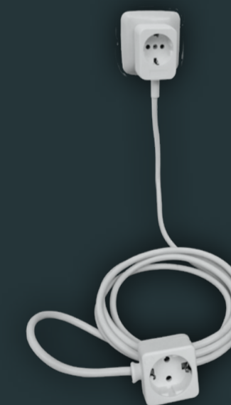
Kabelsystem S, Art.-Nr. 23000

Wenn's länger werden soll. Auch dafür haben wir eine Lösung parat: Verlängerungskabel, Art.-Nr. 20026 mit Zusatzsteckdose am Steckerende. Drei Meter Länge sorgen für ordentlich Reichweite.