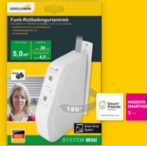
Funk-Rollladengurtantrieb, Art.-Nr. 22576