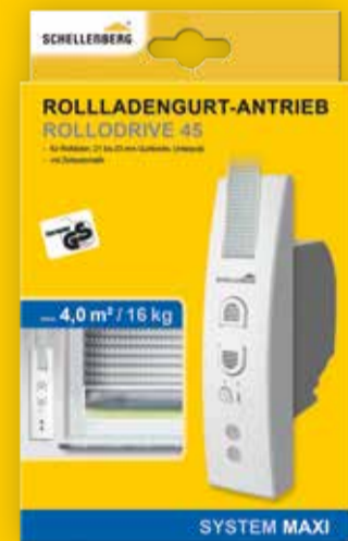
Rollladengurtantrieb, Art.-Nr. 22745