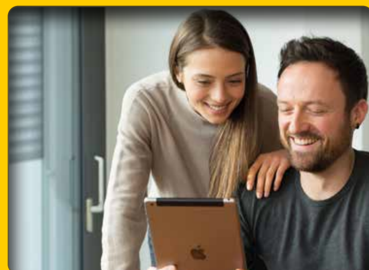
Smart Home-Steuerung per Smartphone oder Tablet