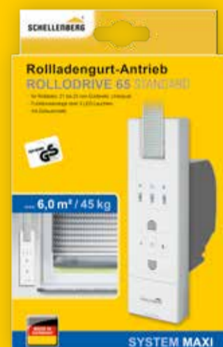
Rollladengurtantrieb, Art.-Nr. 22765