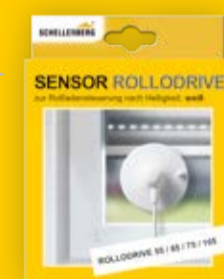
Sonnensensor, Art.-Nr. 22720 / 22746