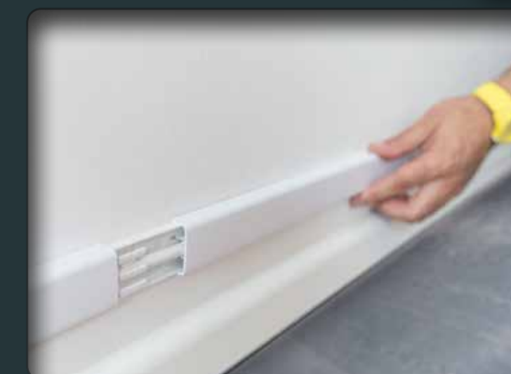
Einfach und sauber: Schlaufen legen statt Kabel schneiden