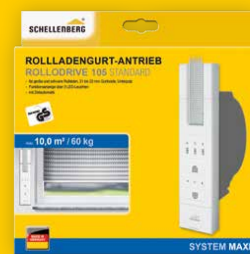
Rollladengurtantrieb, Art.-Nr. 22710