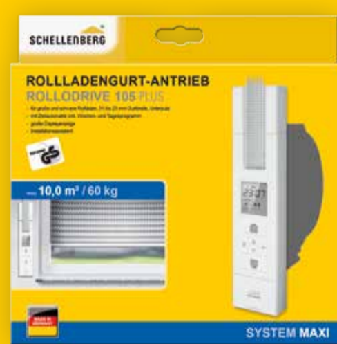
Rollladengurtantrieb, Art.-Nr. 22711