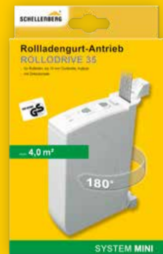
Rollladengurtantrieb, Art.-Nr. 22735