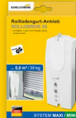
Rollladengurtantrieb, Art.-Nr. 22755