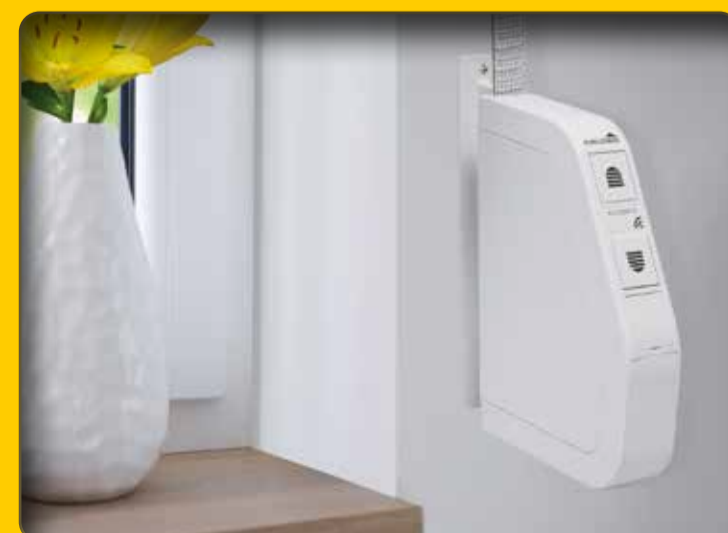
Funk-Rollladengurtantrieb ROLLODRIVE 75, 180° schwenkbar