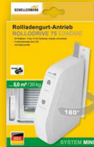
Rollladengurtantrieb, Art.-Nr. 22575