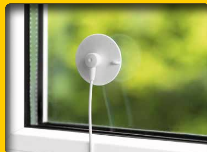
Sonnensensor - für optimales Raumklima